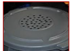
大孔的网罩和有孔顶盖无法阻挡蚊子出入