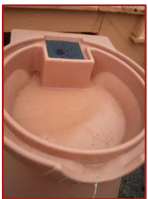
经过改型或装饰性的顶盖会积聚起足以让蚊子滋生的积水