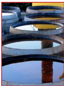
不要让水漫过网罩或者积聚在桶盖内