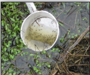
Los mosquitos inmaduros (larvas) parecen pequeños gusanos en la superficie o nadando en el agua.

Distrito de Control de Mosquitos y Vectores del Valle de San Gabriel